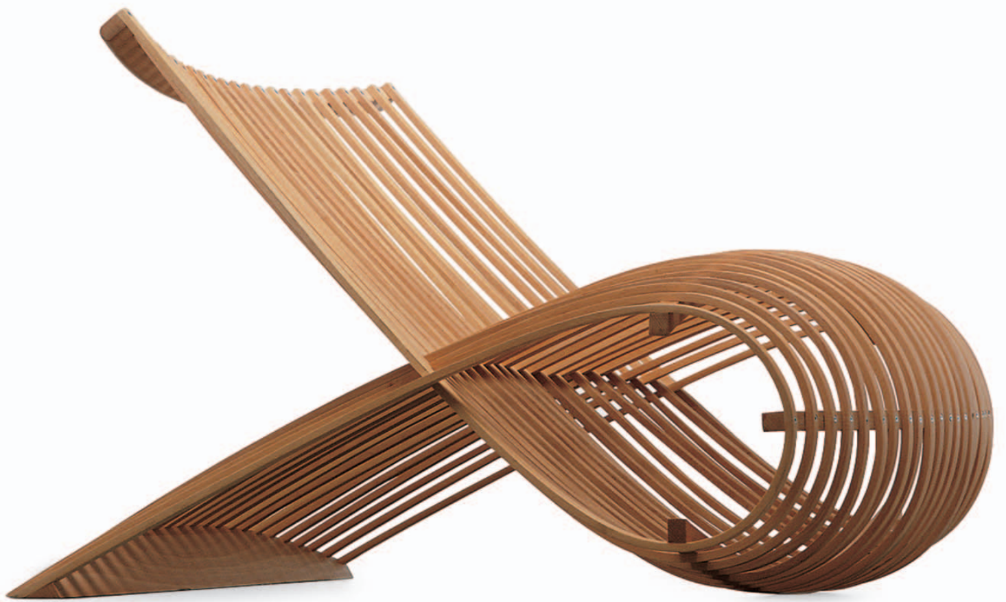
WOODEN CHAIR Marc Newson 1992